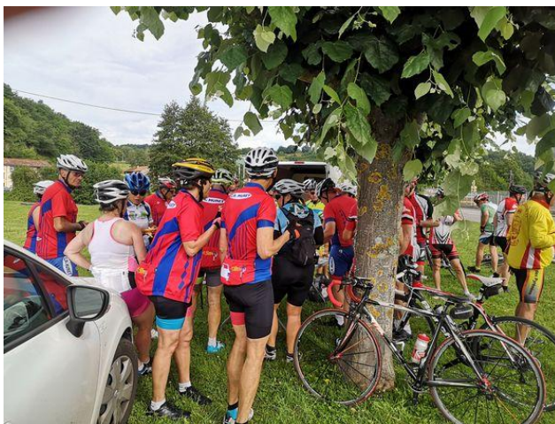
Ravitaillement à Salies du Salat