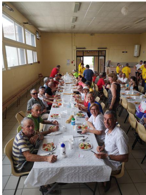
Au repas du club organisateur dans la salle des Fêtes de Rouède