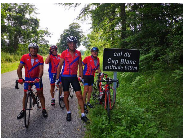
Sur le parcours de 92 km