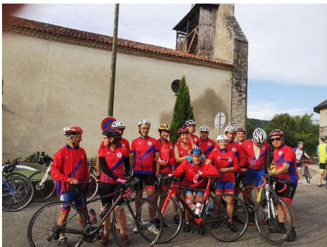
Les 15 Muretains au départ de la salle des Fêtes de Rouède

Très bonne organisation du Vélo Club du Canton d'Aspet. Merci aux organisateurs. Donc à l'année prochaine